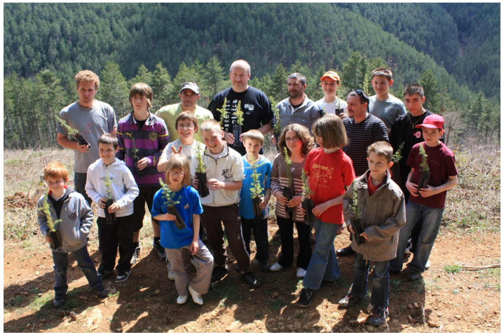
La plantation de 1600 arbres lancée par les élèves de l'école moto As de Trèfle.